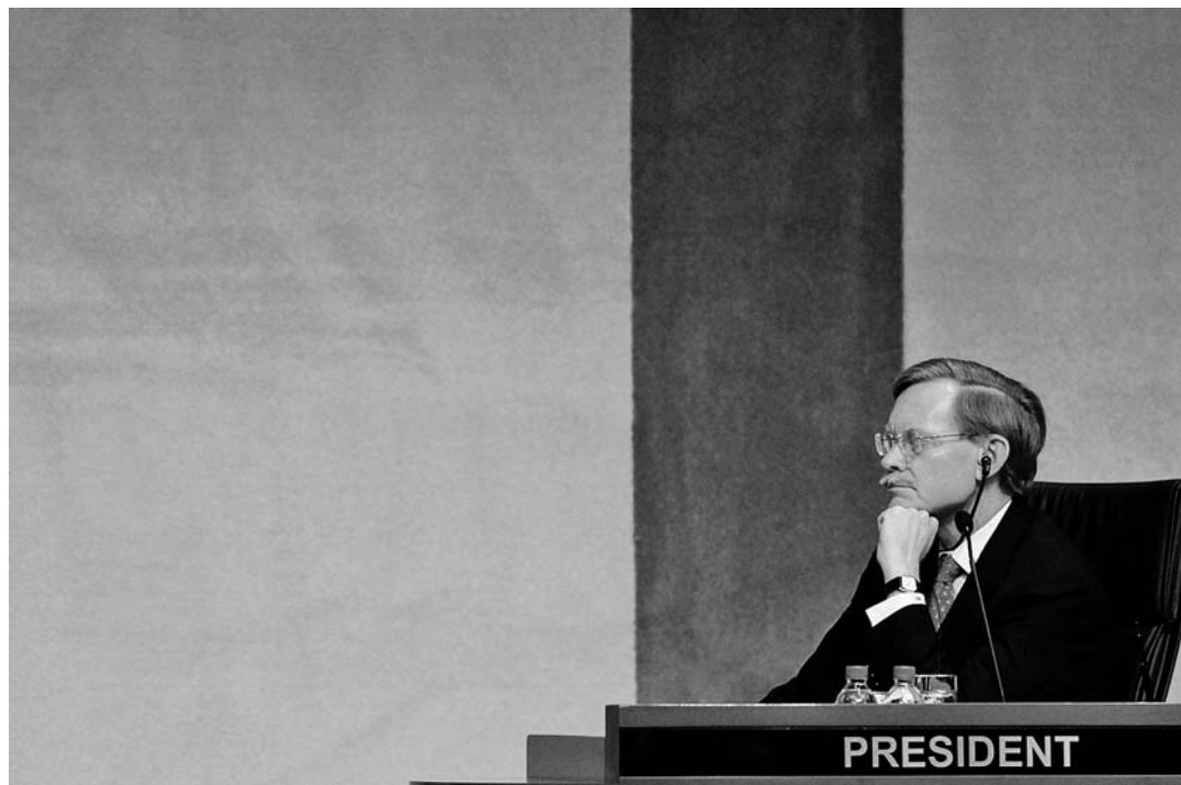
Robert Zoellick, le président de la Banque mondiale, à l'ouverture des assemblées annuelles de son institution et du Fonds monétaire international, à Istanbul, le 6 octobre.

promet-il, nous réaliserons les 100 milliards de dollars de prêts pour les pays à revenu moyen en trois ans, à travers notre Banque internationale pour la reconstruction et le développement [BIRD]. Il garantit que les pays pauvres qui relèvent de l'Association internationale de développement (AID), soit 42 milliards de dollars en trois ans, demeurent la priorité.